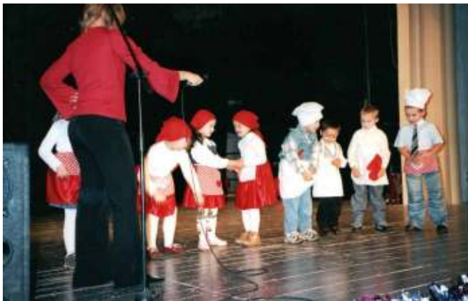
Slovensko-európska kultúrna spoločnosť FEMAN, projekt KE-09

Športové aktivity v 4 projektoch spestrili život ťažko postihnutých ľudí v Gelnici, Žiline, Trenčíne, Šintave. Okrem toho, DSS v Šintave umožnil svojim klientom výlety na trojkolesovom bicykli. V Bratislave vzniklo komunitné bezbariérové fitcentrum s parametrami a službami prispôsobenými potrebám zdravotne postihnutých ľudí.