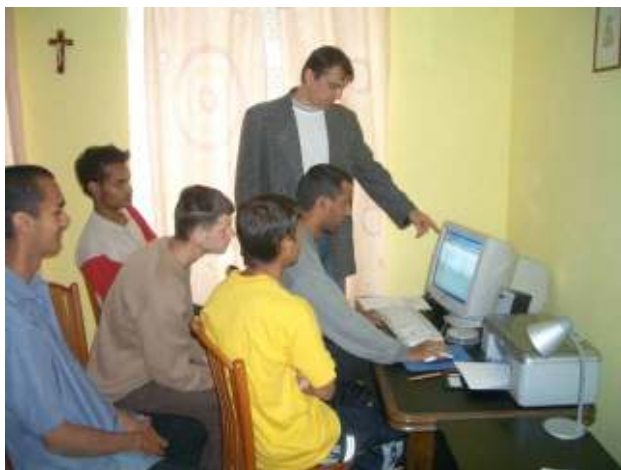
Spišská katolícka charita, projekt KE- 20

Dramatoterapia bola súčasťou 4 projektov, či už prostredníctvom spolupráce s folklórnymi súbormi alebo samostatnou dramatickou výchovou. Predstavenia FS Javorček, FS Jasanima, DSS Rohov a Divadla z pasáže sa stretli s veľkým úspechom u verejnosti.