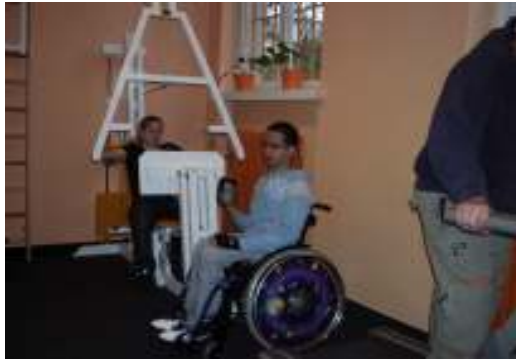
Komunitné fitcentrum, projekt BA- 22

Športové aktivity v 4 projektoch spestrili život ťažko postihnutých ľudí v Gelnici, Žiline, Trenčíne, Šintave. Okrem toho, DSS v Šintave umožnil svojim klientom výlety na trojkolesovom bicykli. V Bratislave vzniklo komunitné bezbariérové fitcentrum s parametrami a službami prispôsobenými potrebám zdravotne postihnutých ľudí.