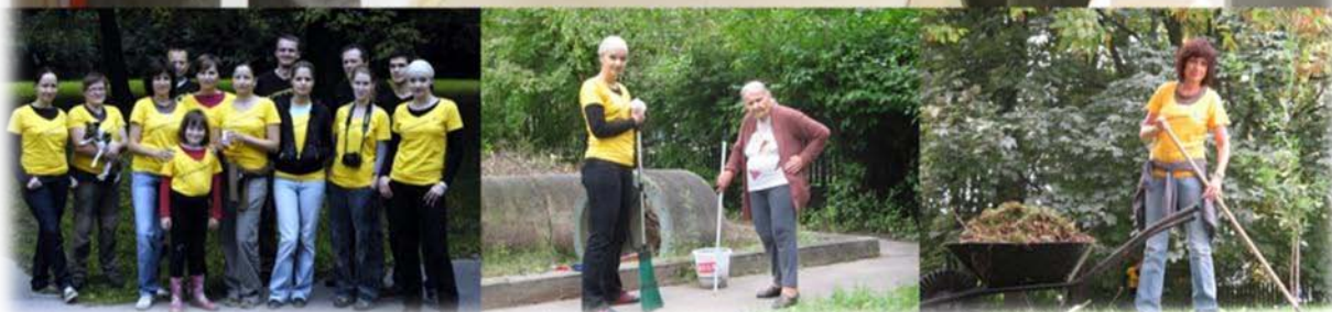
Fotodokumentácia z dobrovoľníckeho dňa v DSS Hestia